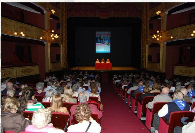
Font: Ajuntament de Girona. Diada de la Gent Gran