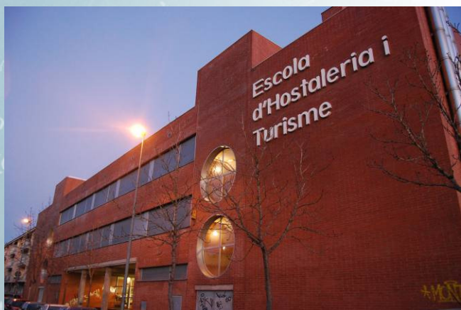
Font: Ajuntament de Girona