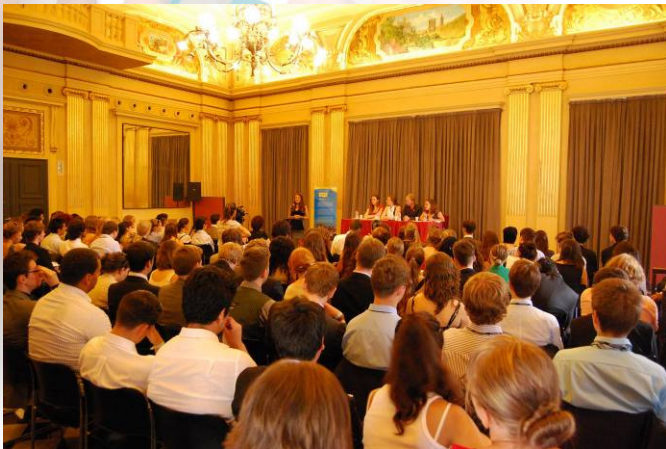
Font: Ajuntament de Girona